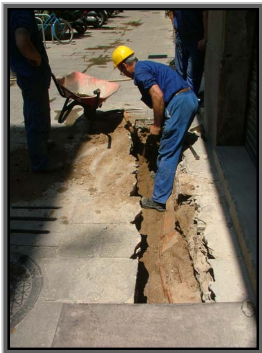
1. Operari retirant sauló de la rasa.