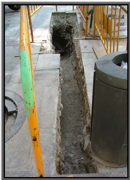
2. Rasa per la millora de la xarxa elèctrica.